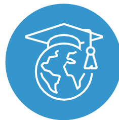
በቀጣይነት-ለሚመጣው ዝግጁ-ሆኖ መገኘት