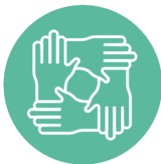
በ'CONNECTED TO SCHOOLS' ውስጥ መሆን