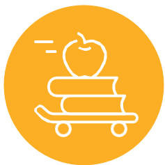
በቀለም-ትምህርታዊ አሠራር፣ ስኬት ማግኘት